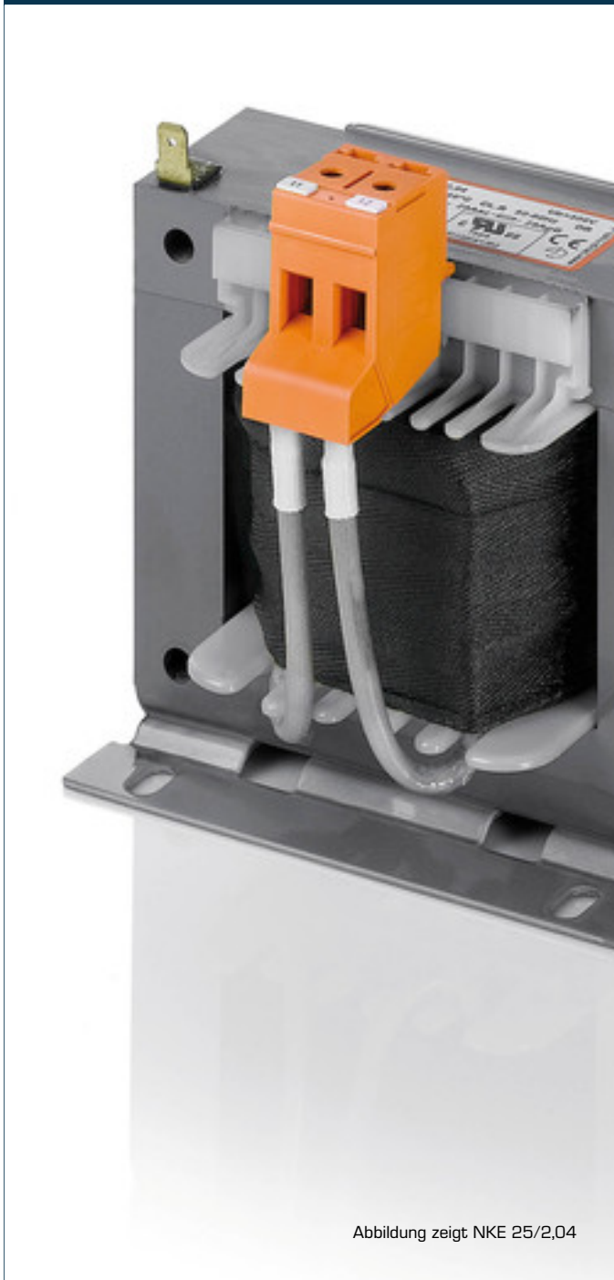
Abbildung zeigt NKE 25/2,04