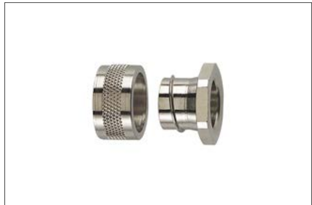
HeliaGuard SC-PC Einführungsbuchse.