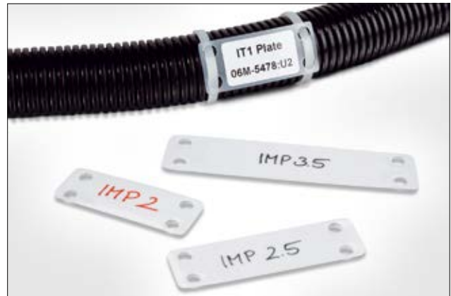
IT-/IMP-Plättchen – deutliche Lesbarkeit bringt Sicherheit.