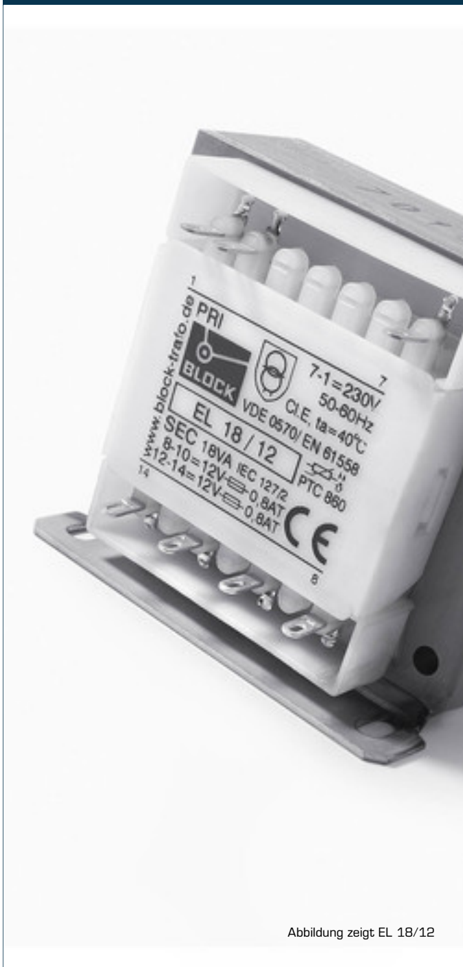
Abbildung zeigt EL 18/12