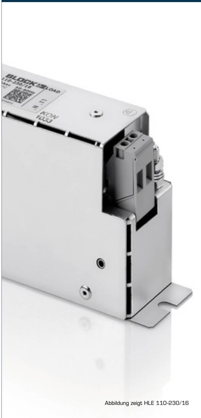
Abbildung zeigt HLE 110-230/16