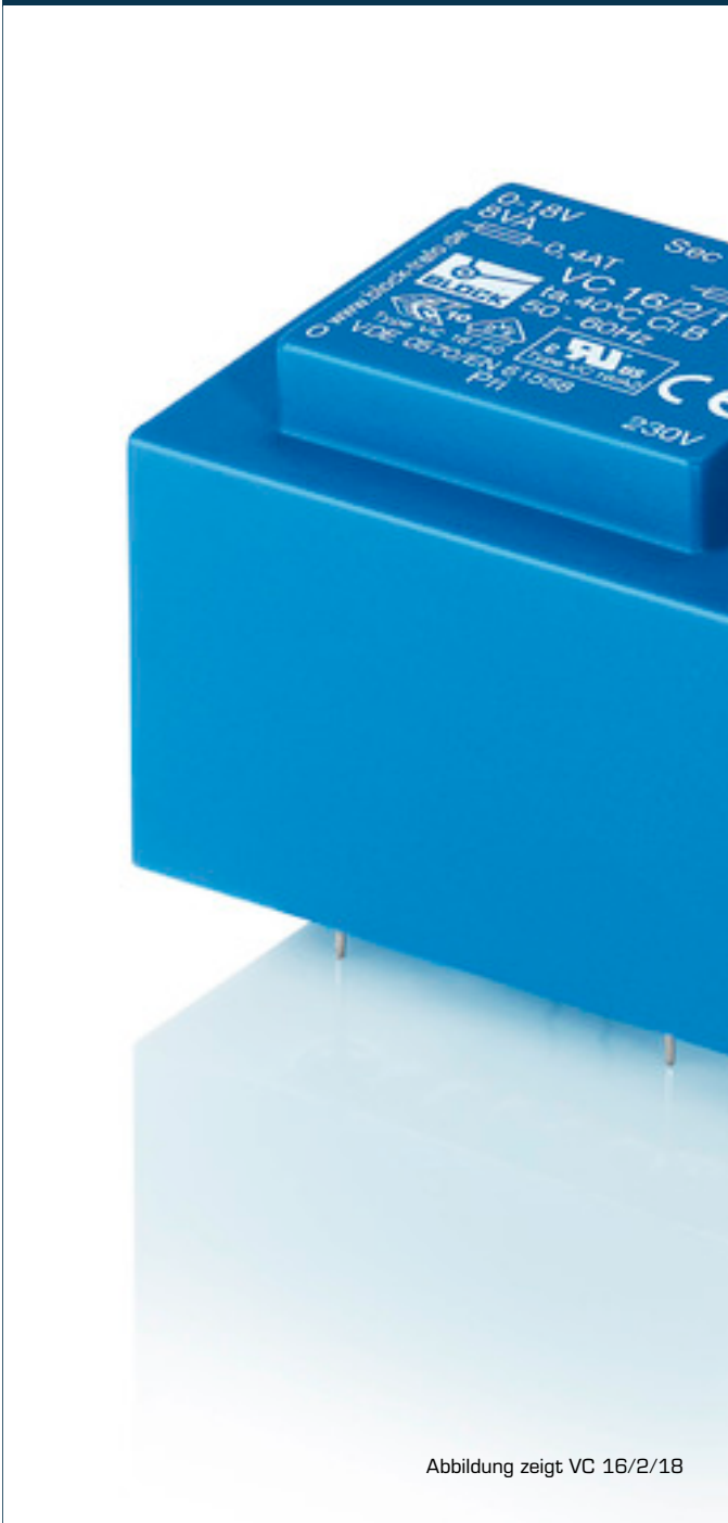
Abbildung zeigt VC 16/2/18