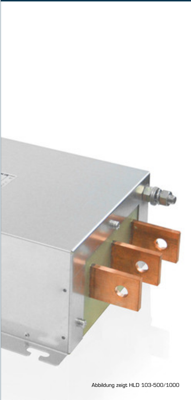
Abbildung zeigt HLD 103-500/1000