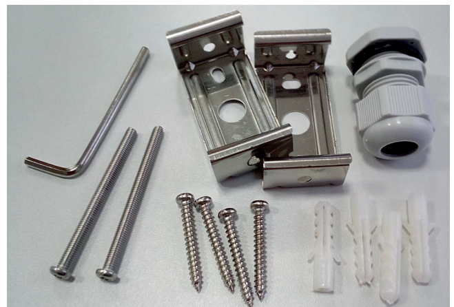
Abb. 3: Set Montagematerial