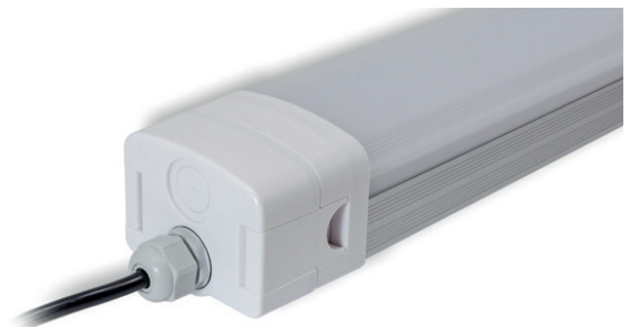
Abb. 6: LUPO mit Anschluss

abalight GmbH Daruper Straße 2 D-48727 Billerbeck Germany