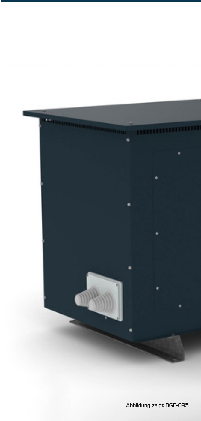
Abbildung zeigt BGE-095

Universal-Stahlblechgehäuse für Schutzart IP23