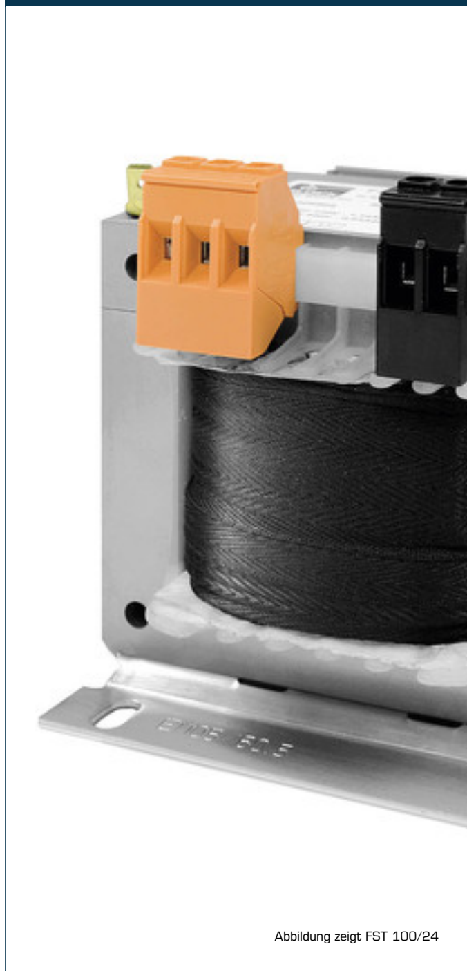
Abbildung zeigt FST 100/24