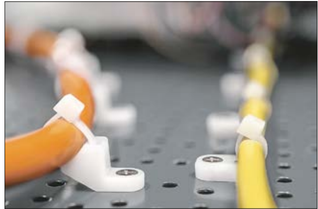
LKM, CL8 (l) und FH (r) Befestigungssockel für Anwendungen mit geringem Platzbedarf.