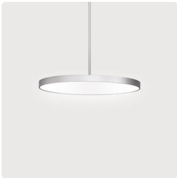
Abbildungen ggf. nur ähnlich, dienen als Orientierung.