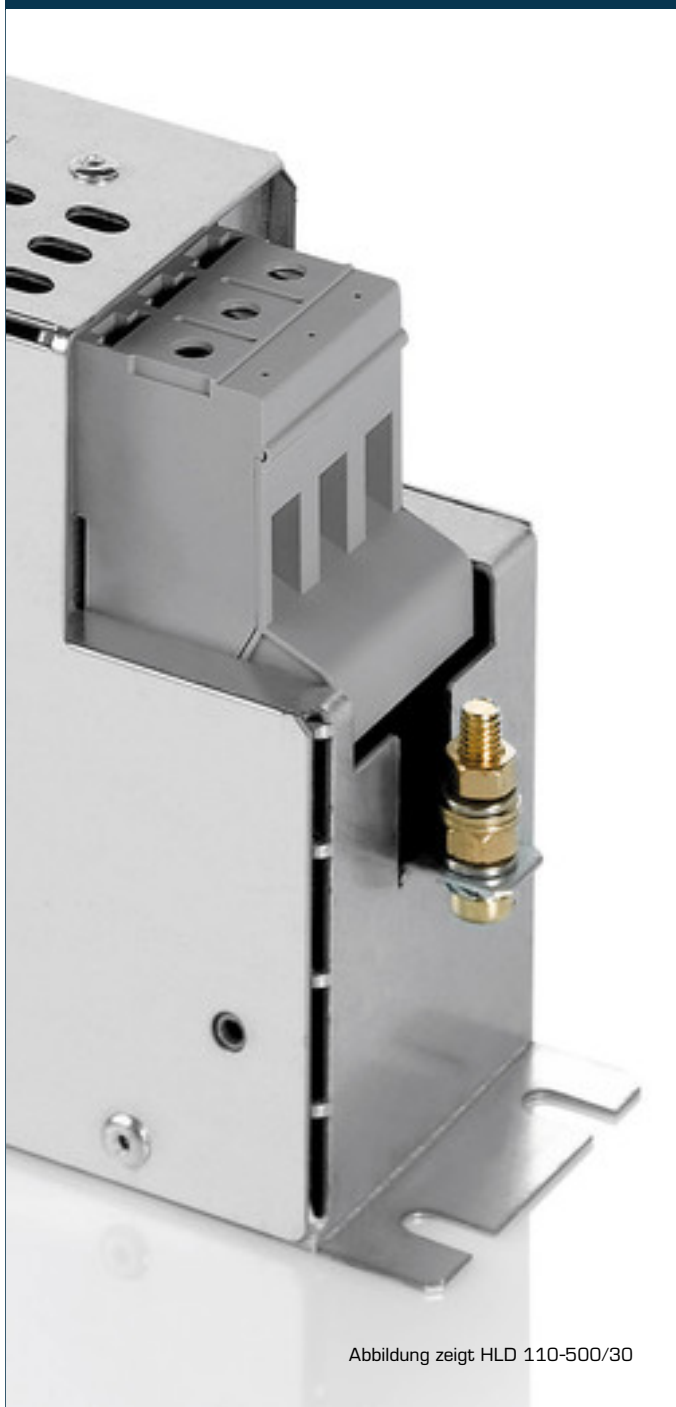
Abbildung zeigt HLD 110-500/30