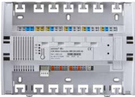
4 AC Motor Controller WM