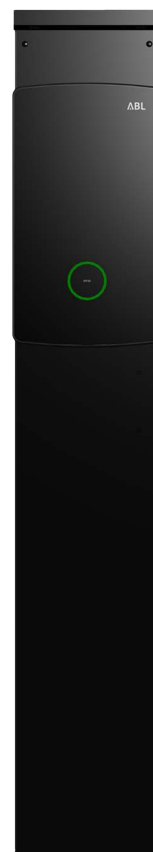
Lieferung ohne separat erhältliche Wallbox eM4 Single

Die Stele POLEM4 Single dient zur Montage einer Wallbox eMH1 (mit oder ohne Montageplatte WHEMH10, 1W0001 oder PVEMH10), eMH2 oder eM4 Single von ABL. Die POLEM4 Single überzeugt durch ihr ansprechendes und kompaktes Metallgehäuse mit rückseitiger Gehäusetür zum Schutz der Einbauten. Die Stele ist durch integrierte Anschlussklemmen vollumfänglich vorinstalliert. Eine zusätzliche, freie Hutschiene ist für weitere Einbauten vormontiert und eine C-Schiene für die Zugentlastung der Zuleitung vorgesehen. Mit dem Wetterschutzdach WPR12 und dem Ladekabelhalter CABHOLD ist die Stele farblich abgestimmt (RAL 9011), womit sie sich harmonisch ins Gesamtbild des Ladepunktes einfügt. Durch die ab Werk gesetzten und mit Blindstopfen abgedeckten Gewindebolzen ist kein nachträgliches Bohren notwendig. Dank der im Kopfteil integrierten LEDs mit Dämmerungsschalter ist eine ausreichende Beleuchtung der Wallbox auch bei schwierigen Lichtverhältnissen gewährleistet. Für einen stabilen Stand empfiehlt ABL die Montage der Stele auf dem optional erhältlichen Betonfundament EMH9999.