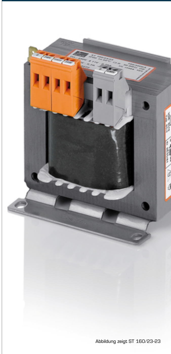
Abbildung zeigt ST 160/23-23