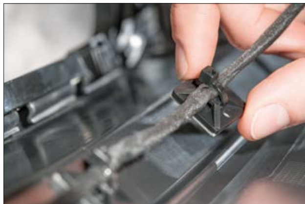
Quadratische SolidTack MB Sockel - schraubbar, selbstklebend - geeignet für eine Vielzahl von Anwendungen wie die Befestigung von Kabeln in der Automobiltechnik.