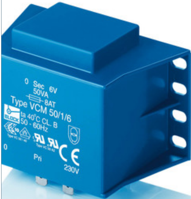
Abbildung zeigt VCM 50/1/6