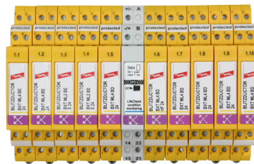
Prinzipialschaltbild DRC SCM XT