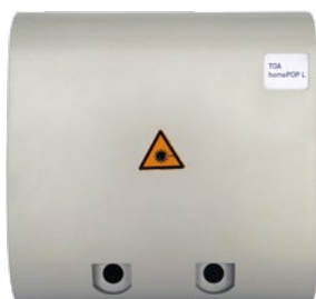
homePOP L geschlossen