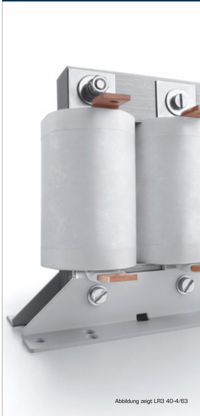
Abbildung zeigt LR3 40-4/63