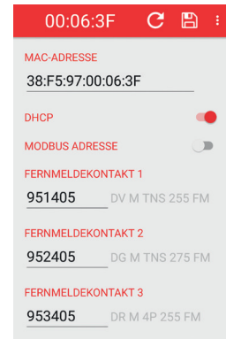
Maßbild DRC AL MODBUS

Kompaktes Hutschienengerät für die Übermittlung von SPD-Statusinformationen wie Funktionsstatus, Artikelnummer SPD und Artikelnummern der Ersatzmodule via Modbus RTU/TCP.