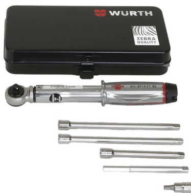
Werkzeugset für HSI 150-DG/HRK SSG