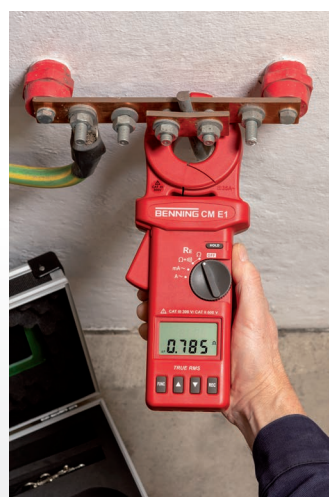
Mesure de la résistance de boucle de terre d'une prise de terre de l'installation