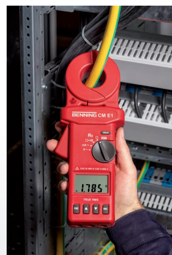
Mesure de la prise de terre du système d'une distribution industrielle