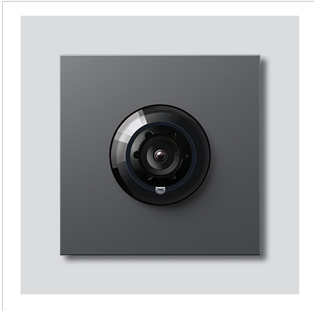
Systemfreie Kamera 130 für Siedle Vario CM 613-03 DG 200048276-03