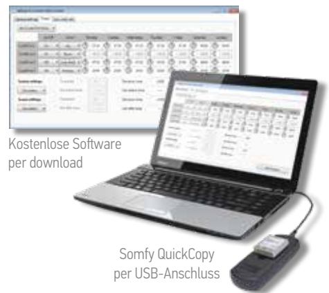
Kostenlose Software per download