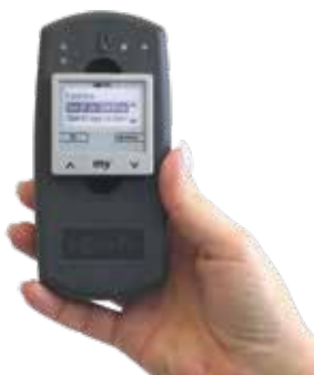
Somfy QuickCopy Batteriebetrieben