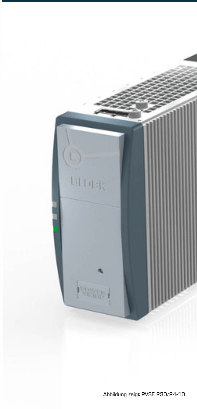
Abbildung zeigt PVSE 230/24-10