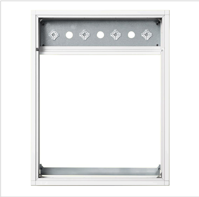
Kombirahmen KR 614-1/1 W 200040852-00

Kombirahmen zur Modernisierung einer bestehenden Türlösung Vario 511 auf die aktuelle Baureihe Vario 611, aus Aluminium-Strangpressprofilen, pulverbeschichtet bzw. lackiert.