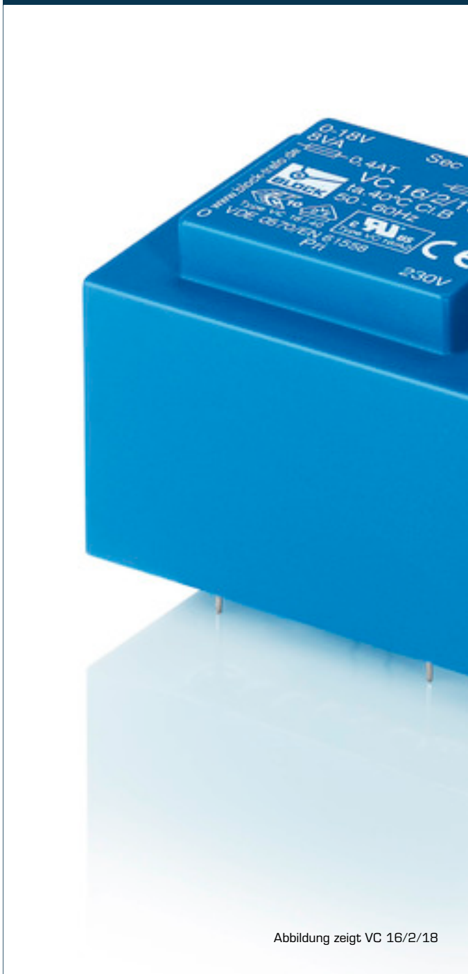
Abbildung zeigt VC 16/2/18