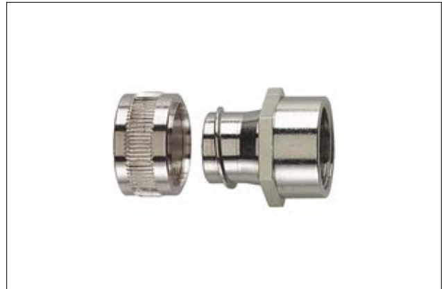
HelaGuard SC-FF mit starrem Innengewinde.