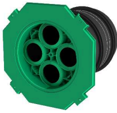
HAW-M ETGAR FR, Hausausführung ETGAR Futterrohr