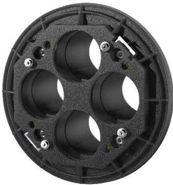
HAW-M ETGAR AD, Mehrfach-Hausausführung ETGAR Außendichtelement