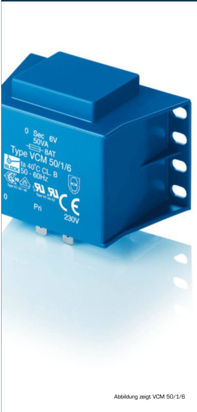
Abbildung zeigt VCM 50/1/6