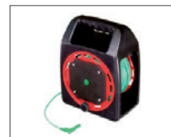
TL-50MKT Verlängerungsleitung 50 m, grün, auf praktischer Kabeltrommel