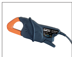
HT4005N Mini-Stromzange, 2 Messbereiche 5/100 A, ab 5 mA bis 100 A AC