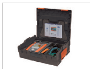
HT-Sortimo L-Boxx Verlickbar-Stapelbar-Kompatibel Ordnung wird tragbar, die L-BOXX von Sortimo passt überall.