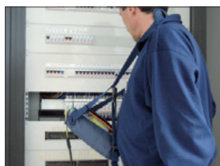
SP-0400 optionale Gerätetasche für freihändiges Arbeiten. Trageturm und Arbeitstasche für COMBI 400er Serie.