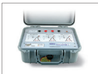
IMP57 Zubehör für Schleifenimpedanzmessung mit hoher Auflösung, max. 200 A Prüfstrom