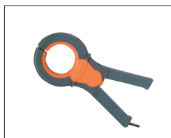
HT97U Zange bis 1000 AC 3 Messbereiche: 10/100/1000 A AC