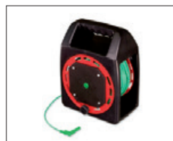
TL-30MKT Verlängerungsleitung 30 m, grün, auf praktischer Kabeltrommel