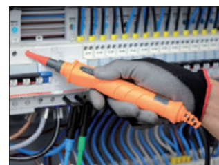
PR400 Externe Prüfspitze mit Start/Stop Taste