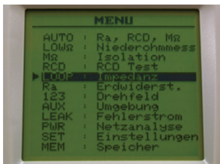
Einfache und übersichtliche Auswahl der Messfunktion