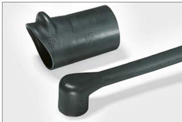
1123-1-G ungeschumpft und vollständig geschumpft.