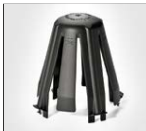
SpotClip-II - Abstandshalter für Einbaustrahler mit 4 zusätzlichen, flexiblen Laschen.