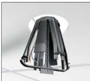
1. Benutzen Sie das mitgelieferte Werkzeug, um den SpotClip schnell und einfach zu montieren.