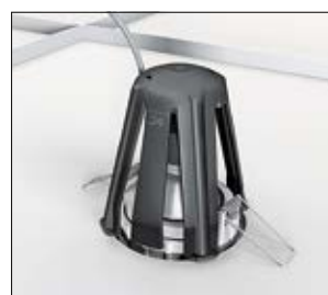
3. Beginnen Sie mit der sicheren Installation des Einbaustrahlers.