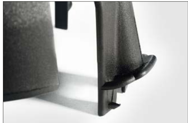
Halteorne und Stützflügel halten SpotClip-II in der gewünschten Position.