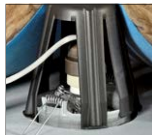
Anwendung mit festem Dämmmaterial.