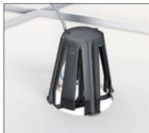
2. Platzieren Sie die Halter in der Aussparung, um ein Verrutschen des SpotClip zu verhindern.