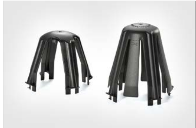
SpotClip-I und SpotClip-II sind geeignet für eine maximale Einbauleuchtenhöhe von 70 mm bzw. 95 mm.