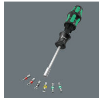
Das Griff/Wechselklingen-System lässt blitzschnellen Austausch der benötigten Klinge und damit vielfältige Anwendungen zu.