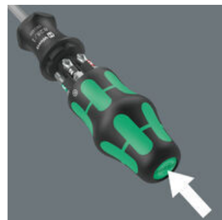
Der Griff kann über einen Betätigungsknopf geöffnet werden. Im Griff ist ein Magazin für 6 Bits integriert.