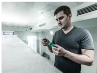
Kraftform Kompakt 27 mit sechs Bits im Griff.