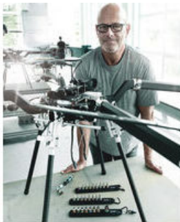
Die Wera Belts