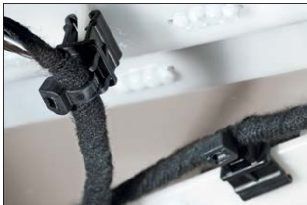
T50ROSEC10 auf eine Kunststoffkante gesteckt.