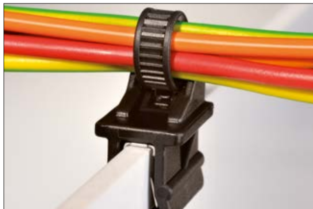
Der 1-teilige Befestigungsbinder T50SOSEC12 kann einfach auf Kanten aufgedrückt werden.

Die silbergraue Klammer, Herzstück unserer EdgeClips, besteht aus doppelt vergütetem Federstahl DIN EN 10132-4 C75S. Der Federstahl verleiht der Klammer sowohl die nötige Stabilität um hohe Abzugskräfte zu realisieren als auch genügend Flexibilität für vielseitige Anwendungsmöglichkeiten. Die zweifache Beschichtung erfolgt zunächst mit einem Zinklamellensystem und anschließender anorganischer Oberflächen-Versiegelung. Selbstverständlich wird hierbei kein Chrom-VI verwendet. Damit entspricht die Klammer der