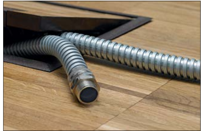
HeloGuard SC galvanisierter Stahlschutzschlauch.