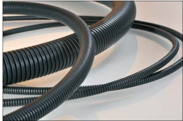
HelaGuard PP wird in Elektroanlagen und Gebäuden eingesetzt, z.B. verlegt in Beton oder Gips.