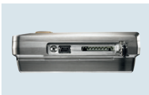
Seitlicher Anschluss von Mini-USB-Kabel und SD-Karte