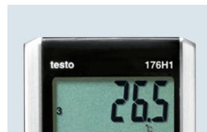
Großes und übersichtliches Display zur Messwertanzeige