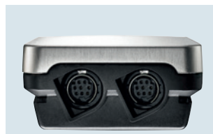
Fühleranschlüsse am unteren Gehäuseende für zwei Temperatur-/Feuchtefühler