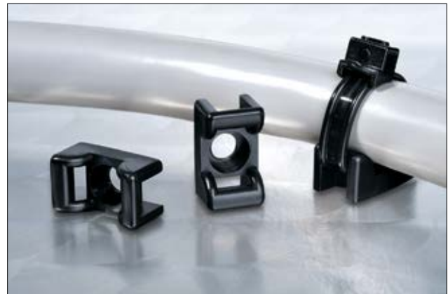
Befestigungssockel KR6G5, KR8G5 und CTM mit gewölbtem Design.