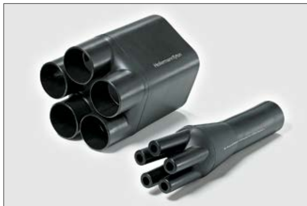
508-5-B8W ungeschumpft und vollständig geschumpft.

Weitere Informationen zu Material und Klebstoff auf Seite 274 und 275.