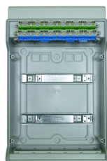
Integrierte Steckklemmtechnik für PE und N.