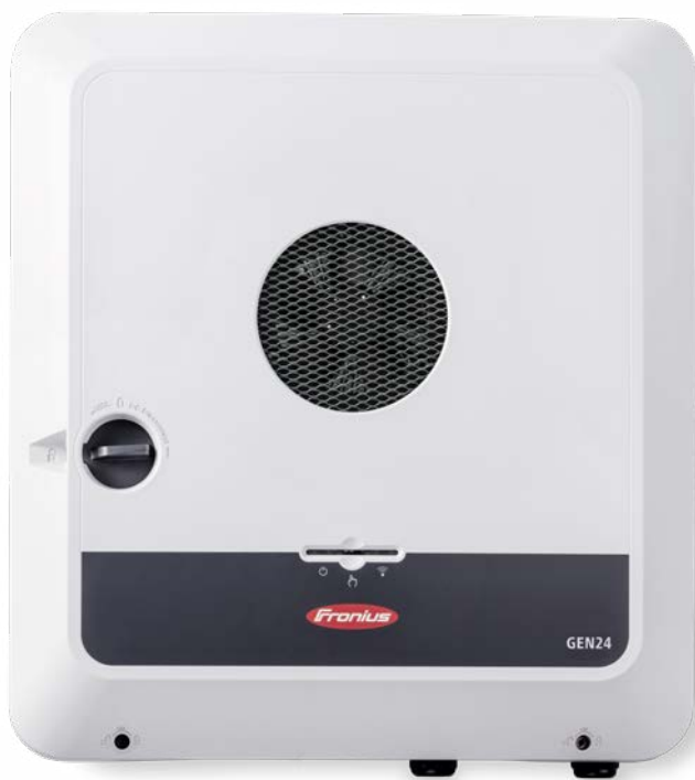
Fronius Symo GEN24 SC