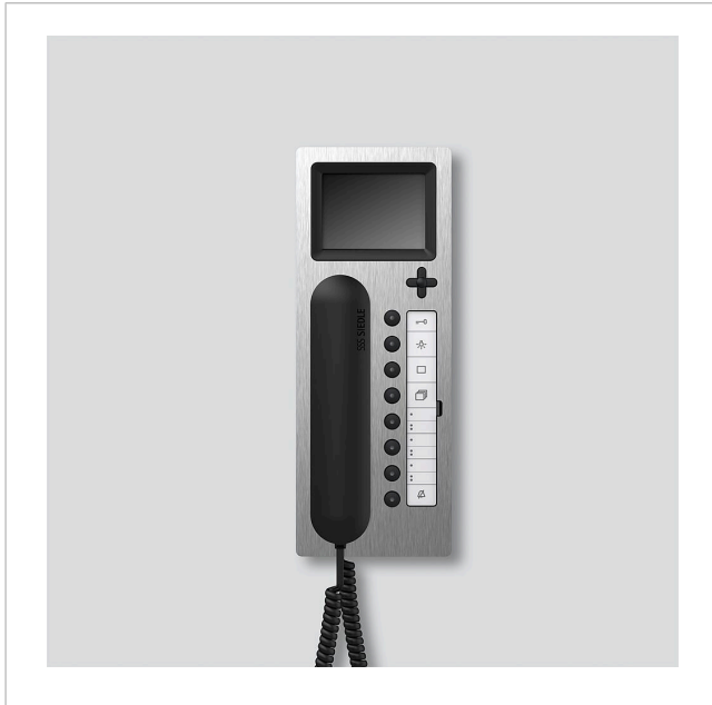
Access Haustelefon Video AHTV 870-0 E/S 200041783-00