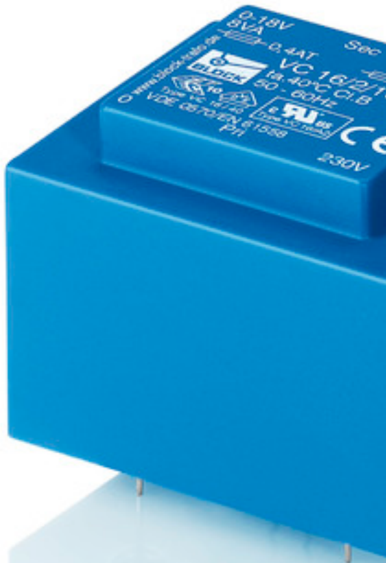
Abbildung zeigt VC 16/2/18