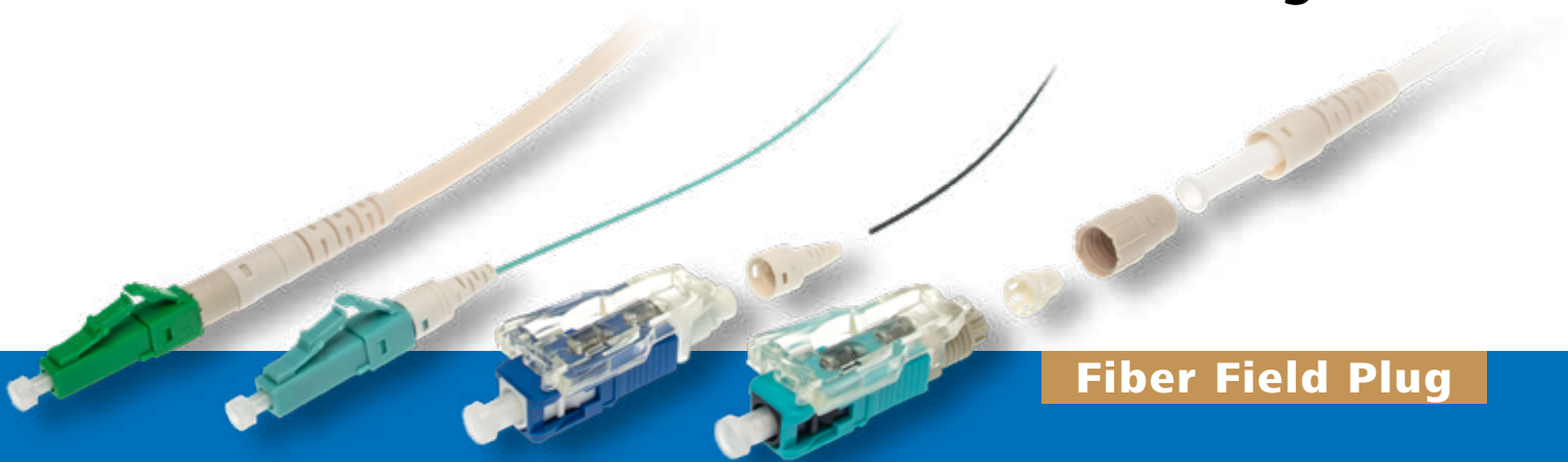
Fiber Field Plug