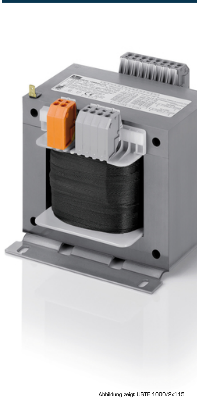
Abbildung zeigt USTE 1000/2x115