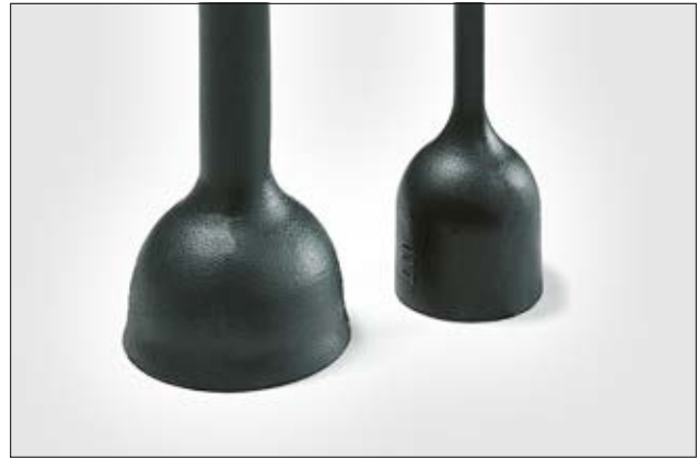
177-1-G ungeschrunft und vollständig geschrumpft.